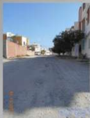
نهج المنجي سليم