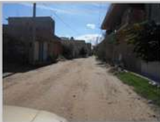
نهج عبد العزيز العروي