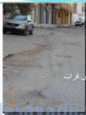
نهج الأسد بن فرات